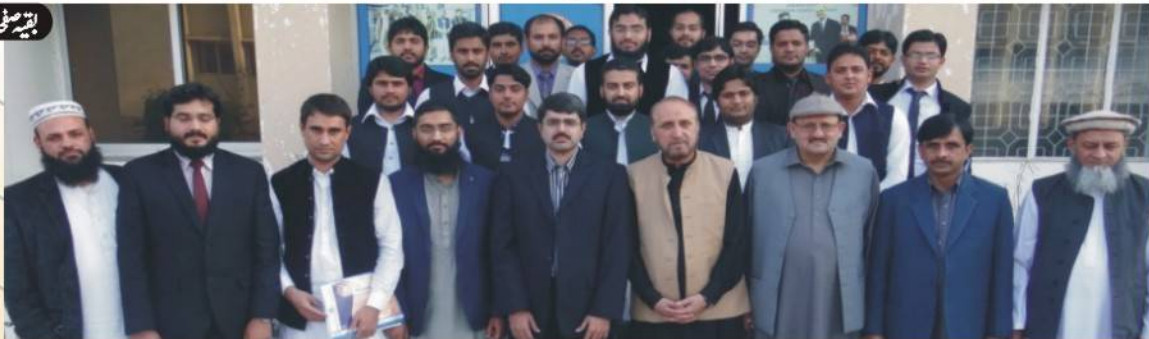
ڈی جی ایچ آر نعیم اللہ کاربنل ٹریننگ سنٹر میں تربیت مکمل کرنے والے ایس ڈی اوز کے ہمراہ گروپ فوٹو