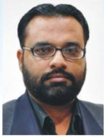
خضر حیات (اسٹنٹ) میکیو ہیڈ کوارٹر ملٹا