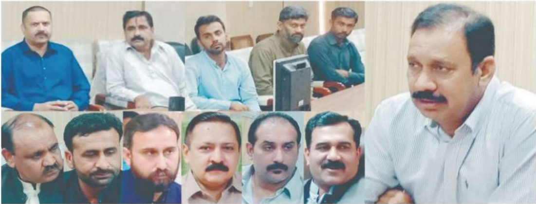
ڈائریکٹر جنرل ایچ آر اینڈ ایڈمنسٹریشن میپکو انجینئر چوہدری خالد محمود مظفر گڑھ سرکل میں منعقدہ اوپن فورم سے خطاب کر رہے ہیں۔